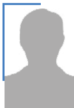
ИВАН СТЕПАНЕНКО Заместитель начальника управления ФСТ России