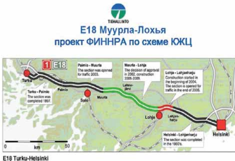
Рис. 1. Трасса E18 Турку-Хельсинки. Контракт охватывает участок Муурла-Лохья (центральный зеленый сегмент)

1. Условия контракта жизненного цикла предполагают, что исполнитель по такому контракту получает деньги только с момента, когда объект предоставлен для публичного использо-