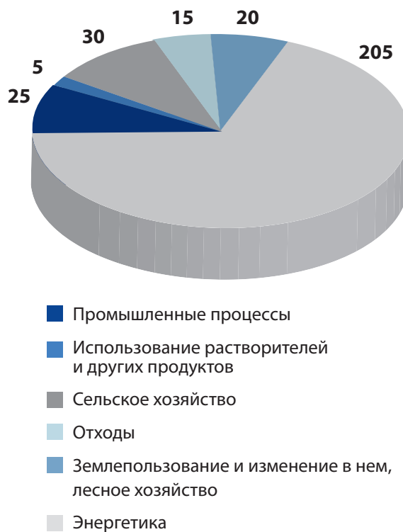
Диаграмма 1. Распределение лимитов выбросов по секторам экономики (млн тонн)

При подготовке заявок необходимо учитывать и тот факт, что в России установлен лимит объема сокращения выбросов – 300 млн т CO 2 -эквивалента за период 2008–2012 гг., а лимит по каждому конкурсному отбору – не более 30 млн т CO 2 -эквивалента (Приказ МЭР РФ). При этом распределение лимитов по секторам выглядит следующим образом: